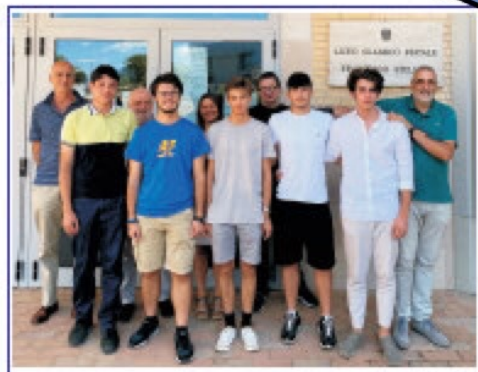
La squadra italiana alle LI IPHO 2022

Qual è la tensione del cavo quando una persona che pesa 500 N sta ferma in piedi sulla trave a 2 m dal muro?